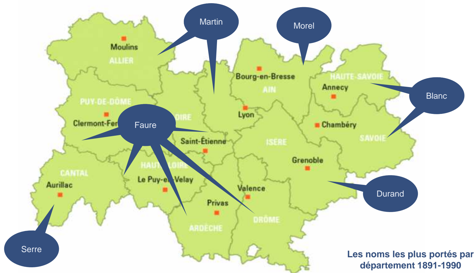
Les noms les plus portés par département 1891-1990